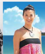
KONISHIKI & TAUPOU