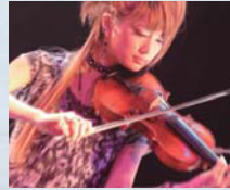
Sword of the Far East ロックバイオリニストAYASA率いる インディーズバンド。