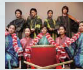
南ぬまナ太陽 (パイスマナティータ)