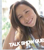
アンジェラ・マキ・バーノン

サーフィン雑誌やテレビ番組でモデルやパーソナリティ等幅広く活動し、ハワイではプロサーファーカリスマロコサーファーとして大人気に。