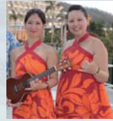
ハワイアンバンド lala kapua

サーフィン雑誌やテレビ番組でモデルやパーソナリティ等幅広く活動し、ハワイではプロサーファーカリスマロコサーファーとして大人気に。