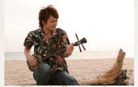
織細ロック三線アーティスト 伊禮俊一