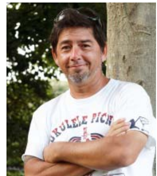
ラブハワイコレクション主宰 ウクレレピクニック主宰 アイランドミュージックフェスティバル主宰 デビット・スミス

2012年11月23日(金祝日)横浜大榎橋ホールにて開催いたしますので、是非、ご参加のご検討をお願いいたします。